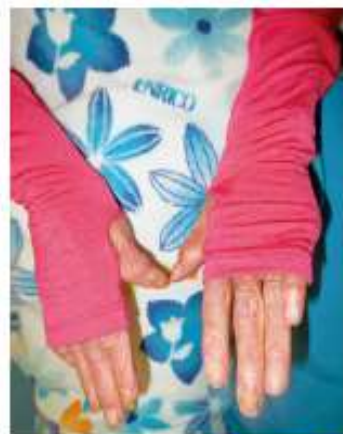
アームカバーの着用