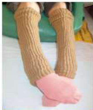
レッグカバーの着用