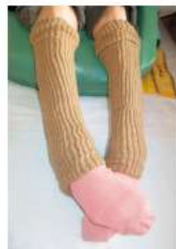
レッグカバーの着用