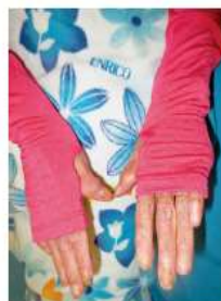
アームカバーの着用